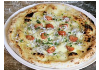
しらすと生トマト

28. しらすと生トマト ..... ¥1,800 モッツアレラ、グラナパダーノ、シラス、トマト ¥1,980(税込)