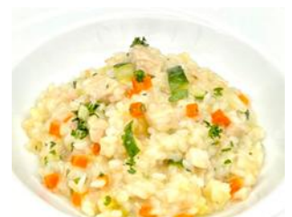
鮮魚と野菜のリゾットビアンコ

19. 鮮魚と野菜のリゾットビアンコ ..... ¥1,600 白身魚と野菜のリゾット チーズ風味 ¥1,760(税込)