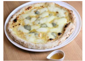
クアットロフォルマッジ

27. クアットロフォルマッジ ..... ¥2,200 4種のチーズ、蜂蜜付き ¥2,420(税込) (ゴルゴンゾーラ、ゴーダ、グラナパダーノ、モッツアレラ)