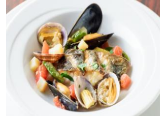
アックア ディ マーレ

Grilled red rice prawn with herbs and bread crumbs