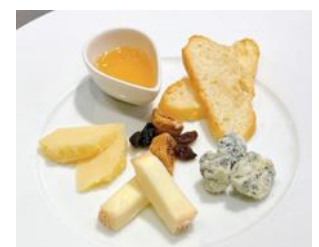
チーズの盛り合わせ

5. インサラータ グランドウーカ (季節野菜のサラダ) ¥800 シェフにおまかせサラダに自家製ドレッシング ¥880(税込)