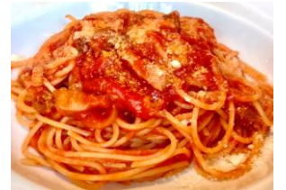
アマトリチャーナ

10.“アマトリチャーナ”ローマ風トマトパスタ …… ¥1,800 パンチェッタ、玉ねぎ、白ワイン、チーズ ¥1,980(税込)