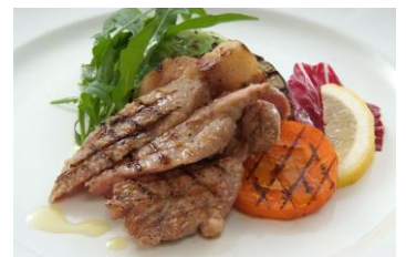
国産ポークのグリル