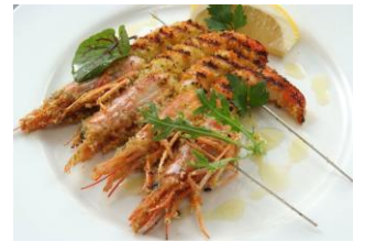
海老の香草パン粉焼き