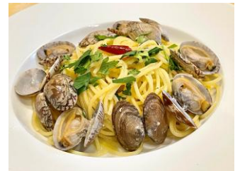
ボンゴレビアンコ

16. しらすとクルミのパスタ ..... ¥1,500 しらすとの相性が高い1品 ¥1,650(税込)