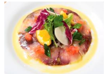
鮮魚のカルパッチョ

2. 本日の鮮魚のマリネ“カルパッチョ”サラダ仕立て ¥1,800 シチリア塩、ワインビネガー、オリーブオイル ¥1,980(税込)