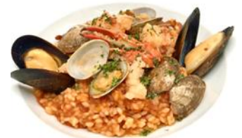
魚介類のリゾットマリナーラ

20. 魚介類のリゾットマリナーラ ..... ¥2,000 南イタリア定番のリゾット ¥2,200(税込)