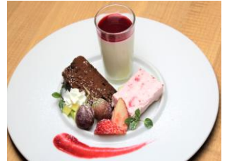
ドルチェ盛り合わせ

“Cannoli Sicilia” 39.シチリアといえば！カンノーリ ..... ¥700 筒状の揚げ菓子、中にはとろ〜りクリームチーズ ¥770(税込)