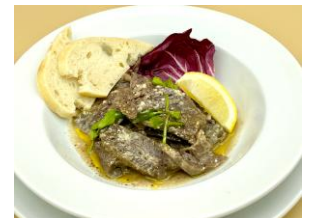
モツ煮込み ミルツァ

4. 生ハムのクリームパテ ..... ¥900 クリーミーな味わいと生ハムがワインにも合います ¥990(税込)