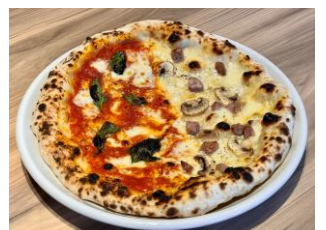
人気No.1ハーフ&ハーフ

30. ハーフ&ハーフ ..... ¥2,000 マルゲリータ&サルシッチャ又はしらす ¥2,200(税込)